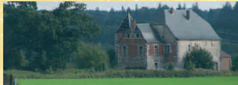
Château de Montbliart - Kasteel van Montbliart

2 : Le «Château» était au 17 e siècle l'habitation d'un Maître de Forge. La tour carrée a été construite au 18 e siècle. Le bâtiment servit de refuge aux habitants de Montbliart lors de nombreuses invasions. Il fut par la suite transformé en ferme au 19 e siècle.