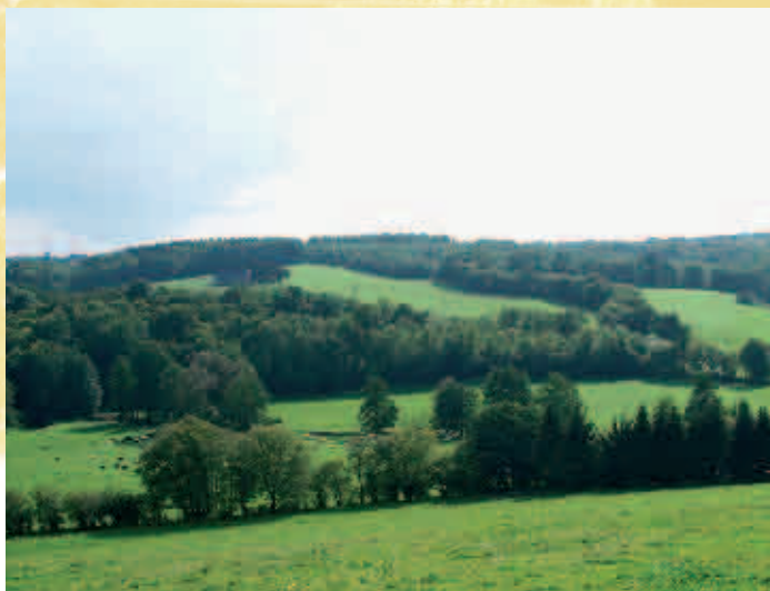
Vallée de l'Eau d'Eppe - Eau d'Eppevallei

1. Start aan de kerk. De wandeling laat u de heuvels en het wallenlandschap van het dorp ontdekken.