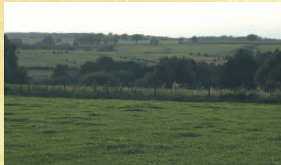
Panorama - Panorama

Cette promenade, aux confins de Beaumont et de Sivry-Rance se déroule sur le nouveau RAVeL et dans de petits chemins agricoles. Vous découvrirez des paysages ruraux à l'habitat dispersé.