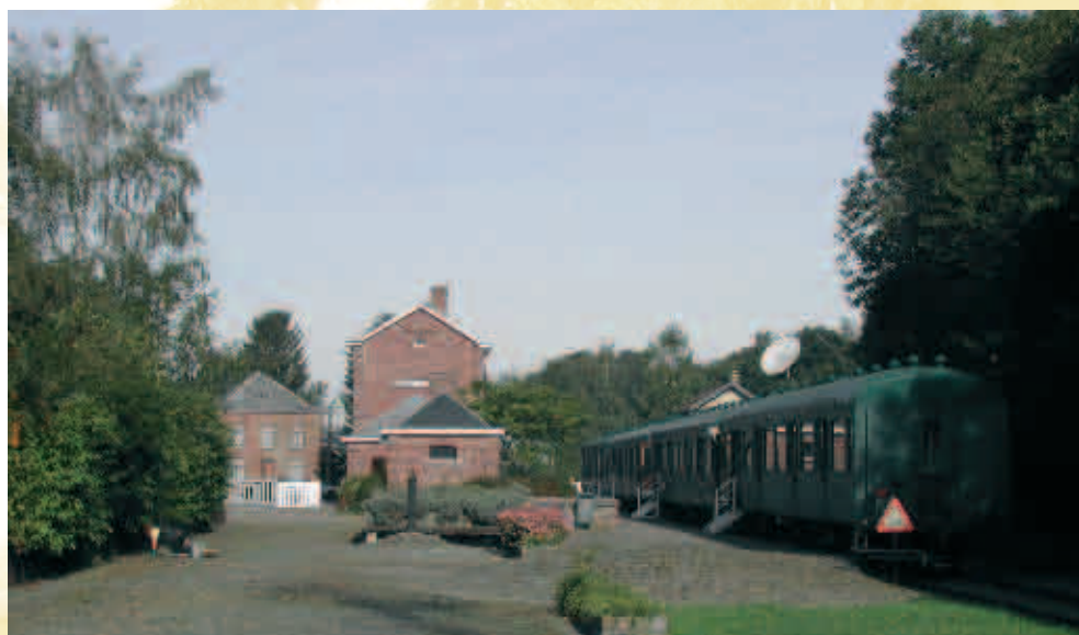
Centre d'étude de la nature et de plein air : CPDA « Recreatie-en openluchtcentrum »

5. De plek die men 'La Carrauterie' noemt, ontleende haar naam aan een oude fabriek waar men plaveien in gebakken aarde maakte. De grond bestaat uit compacte leem die geschikt is voor het bakken.