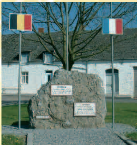
Pierre de la gare à Momignies / Steen van het station in Momignies

5. Het Croix d'Occis , in la Fiacrie Momignies, is een stèle in blauwe hardsteen, opgetrokken door een Bretonse familie. Het stelt een Keltisch kruis voor en herdenkt de luitenant graaf Le Pays de Teilleul, vader van 10 kinderen, die op de leeftijd van 39 de heldendood stierf terwijl hij de aftocht dekde van zijn manschappen en tot eer en glorie van la Grance († 16 mei 1940).