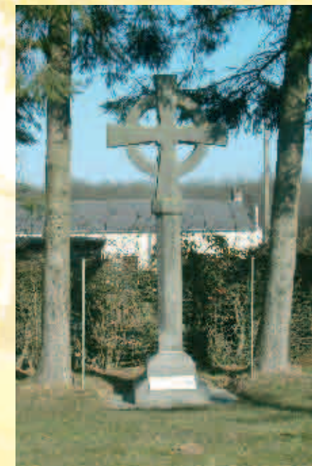
Croix d'Occis de la Fiacrie à Momignies Kruis van « Occis de la Fiacrie » in Momignies