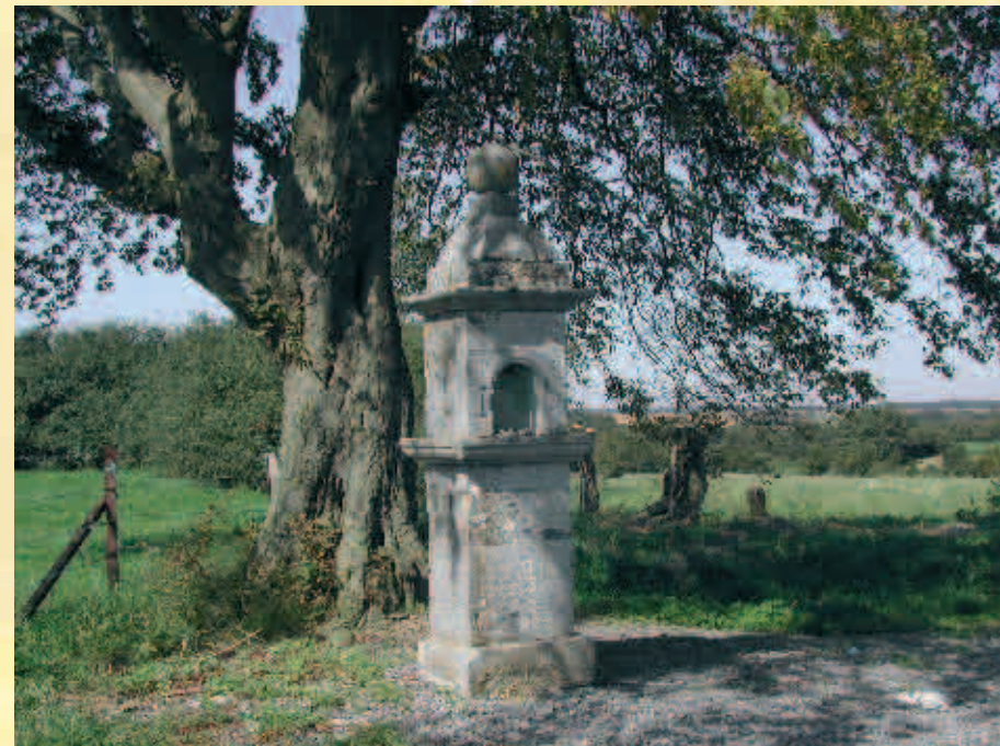
Chapelle Notre-Dame de Messine (1758) / Kapel Notre-Dame de Messine (1758)

La petite place des Arsillières abrite une magnifique plaine de jeux comme on en rencontre dans chacun des villages de Momignies et est entourée de marronniers. Seul un tilleul, témoin du passage à l'an 2000 y a été planté.