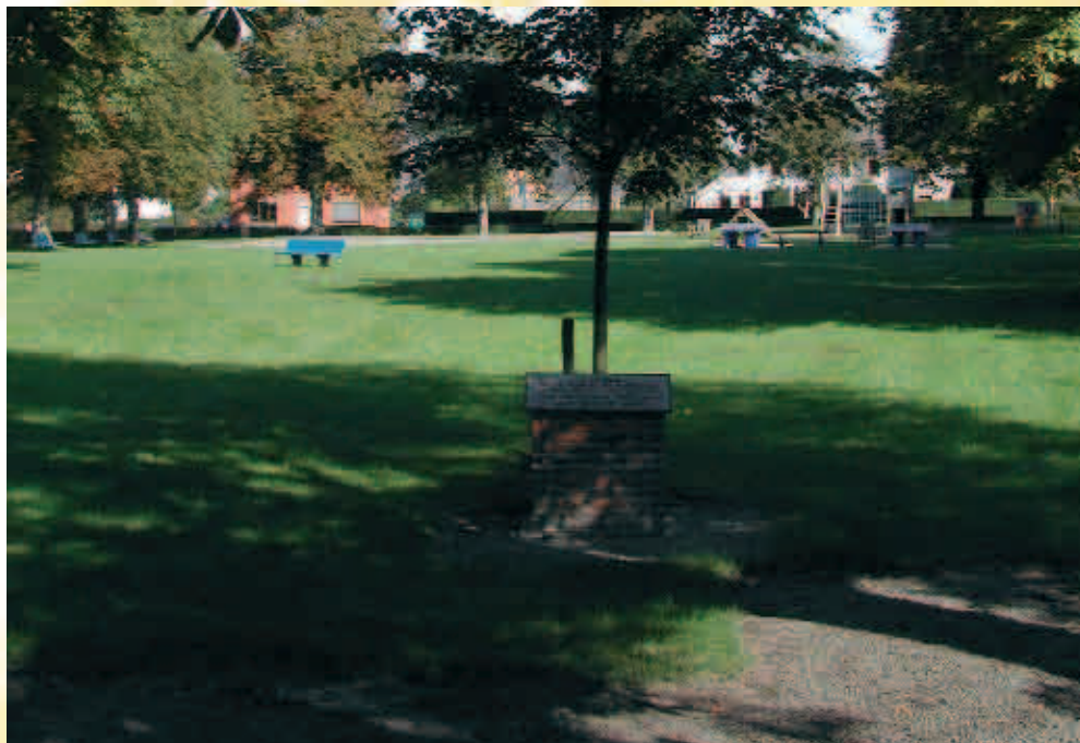
Tilleul de l'An 2000, place des Arsillières / Lindeboom van het jaar 2000, plein van Arsillières

Op de kleine 'place des Arsillières', opgefleurd met kastanjabomen, vindt men een mooi speelplein. Dat ziet men overigens in alle dorpen van de fusiegemeente. In het jaar 2000 werd ter gelegenheid van de millenniumwissel een linde geplant.