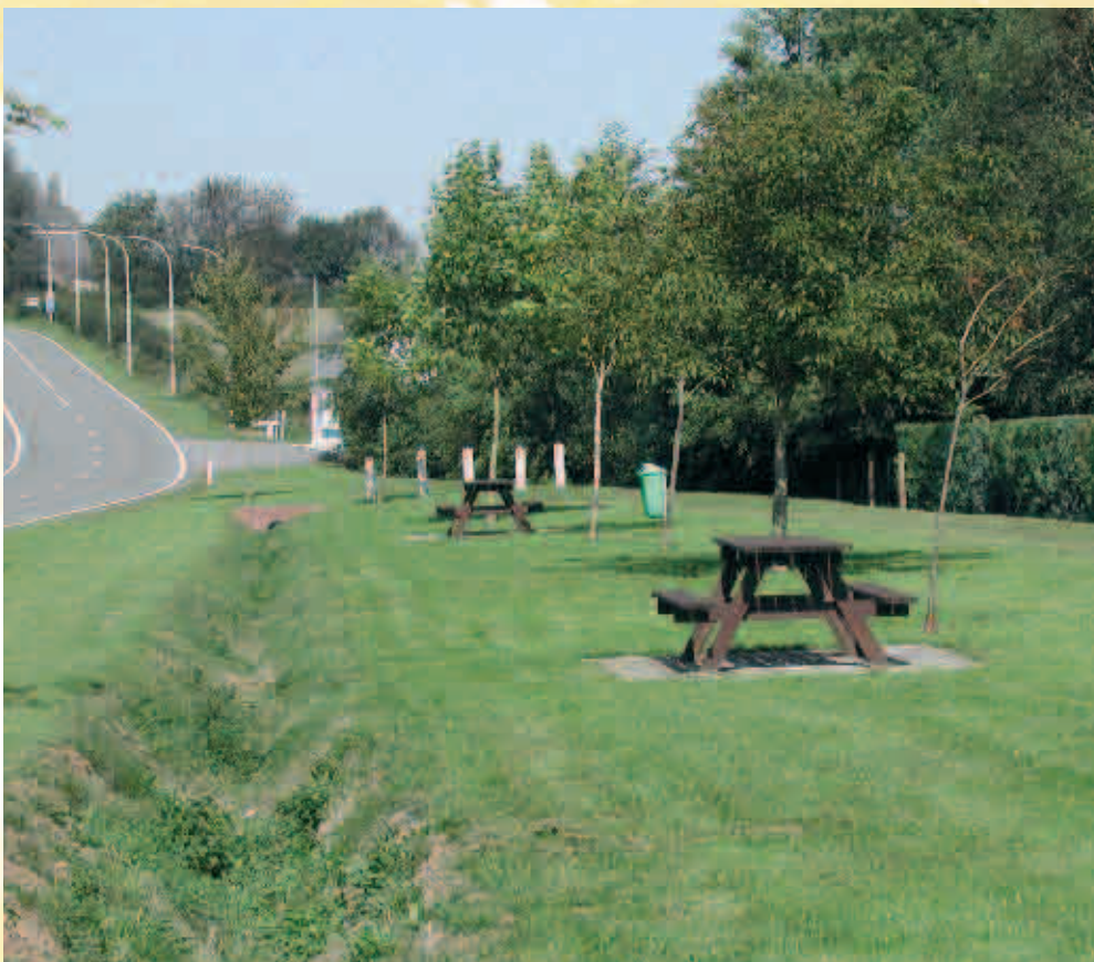
Aire de pique-nique près du Ri Cadart / Pique-nique zone dichtbij de "Ri Cadart"