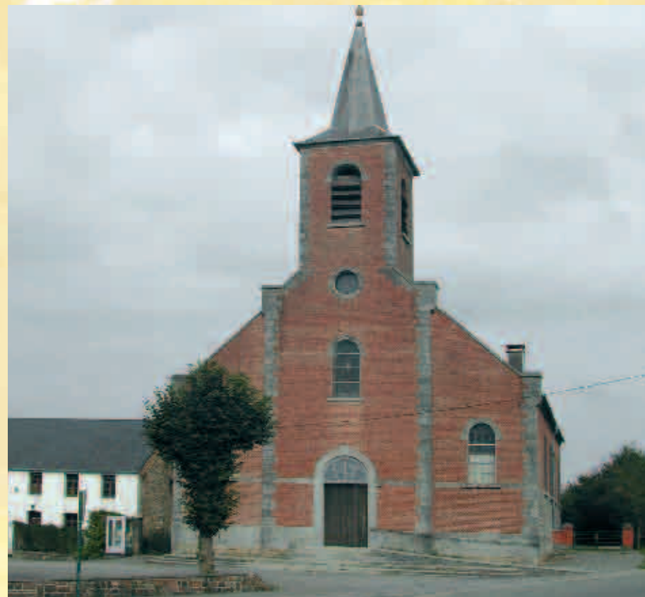
Eglise de Beauwelz / Kerk van Beauwelz

Possibilité de prolongation vers le circuit n° 10