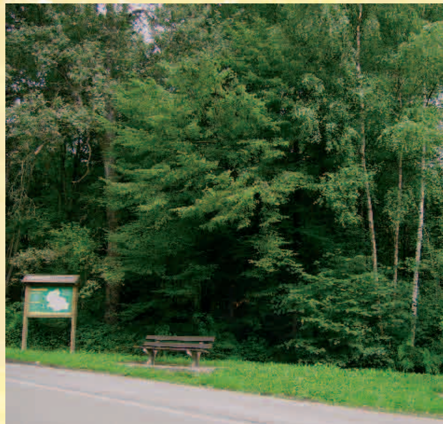
Panneau indicateur /Wegwijzer

Possibilité de prolongation vers le circuit n° 11