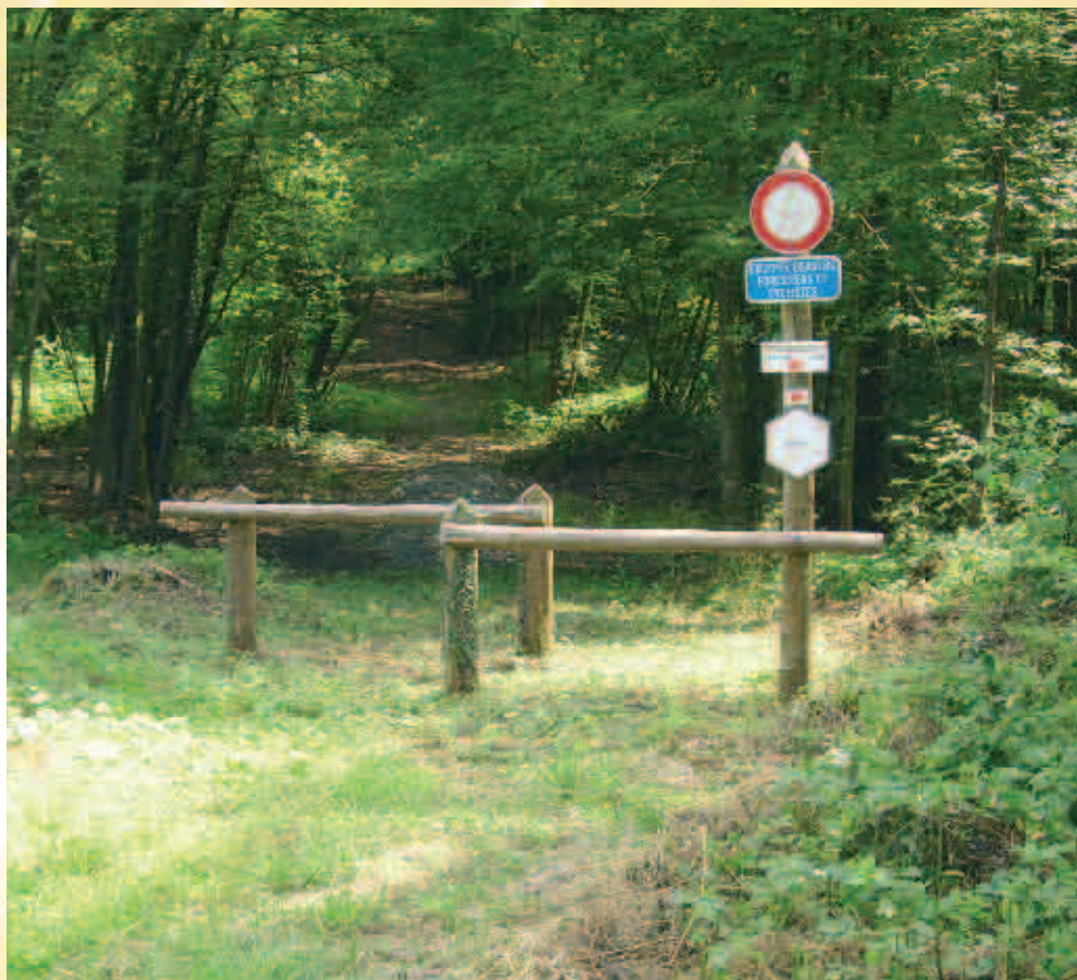
Entrée de la promenade / Ingang van de wandeling