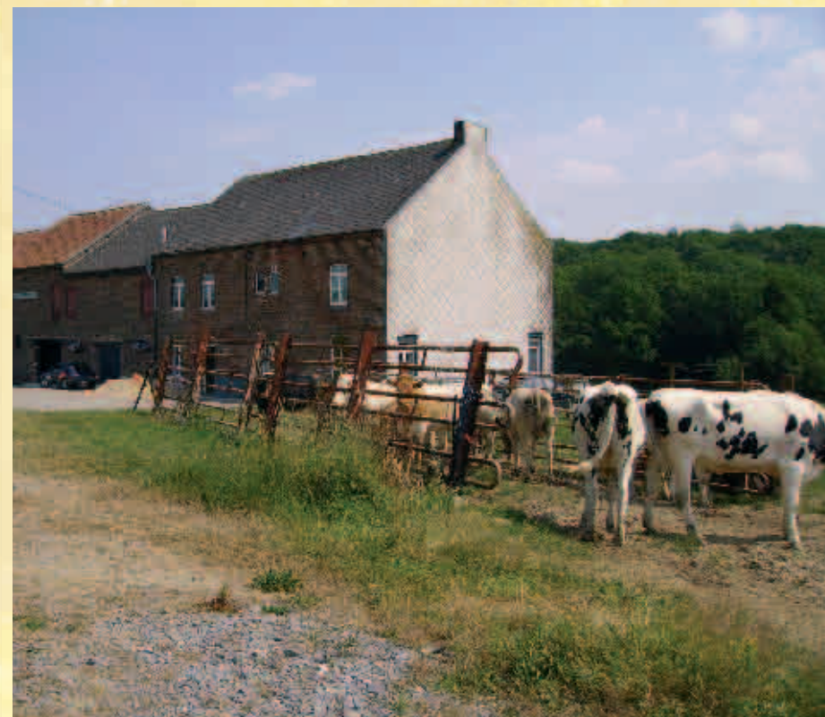
Ferme de l'Artoise / Boerderij l'Artoise

Ce hameau a été un lieu où on a extrait le minerai de fer avant la fin du 16 e s. du côté français. La maison de Gratte-Pierre était appelée « Maison Rouge » par les anciens du village. Cette « Maison Rouge » doit son nom à la couleur des pierres avec laquelle elle fut construite. Ces pierres, résidus des mines de l'endroit, contiennent du fer et se couvrent de rouille par temps humide. Les murs extérieurs prennent alors des teintes rougeâtres. Enfin, signalons que la petite réserve de Gratte-Pierre est, dans notre pays, un des quatre lieux où l'on pourrait trouver de l'or.