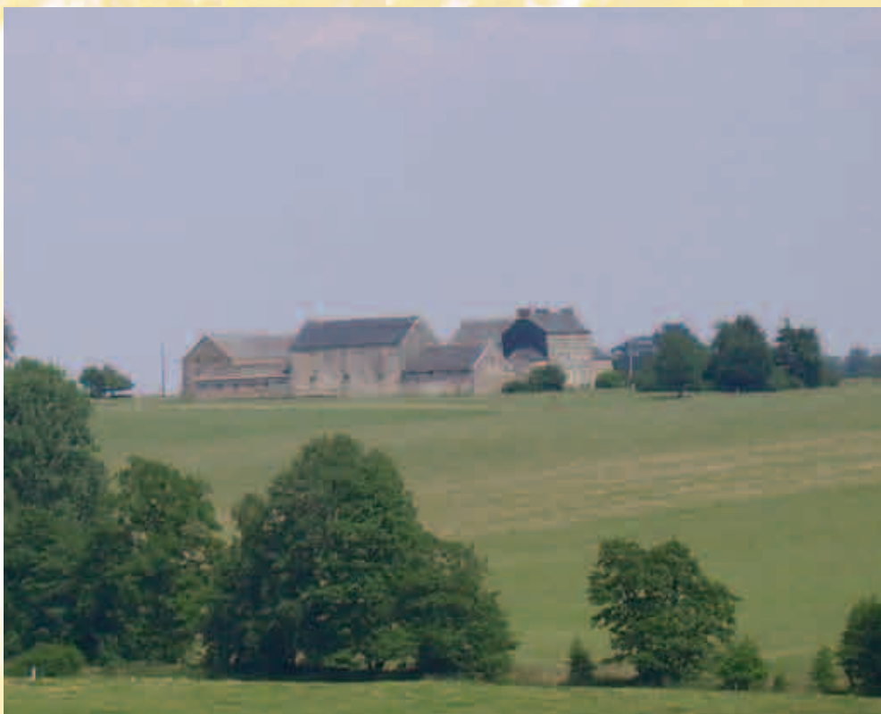
Vue depuis le point de départ de la randonnée / Zicht vanaf het vertrekpunt van de wandeling

Ten slotte willen we nog signaleren dat het kleine reservaat van Gratte-Pierre in ons land een van de vier plaatsen is waar men goud zou kunnen vinden.