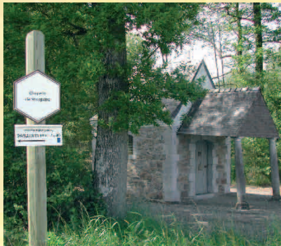
Chapelle de Malapaire / Kapel Malapaire

Le toponyme actuel de Malapaire vient de la famille des Malapert provenant de Mons, maîtres de forges chimaciens qui avaient une entreprise à cet endroit au 16 e s. Une route qui reliait Seloignes à Cendron par la forêt traversait un ruisseau appelé « Malapert ». Ce ruisseau alimentait un vivier appelé lui aussi Malapert.