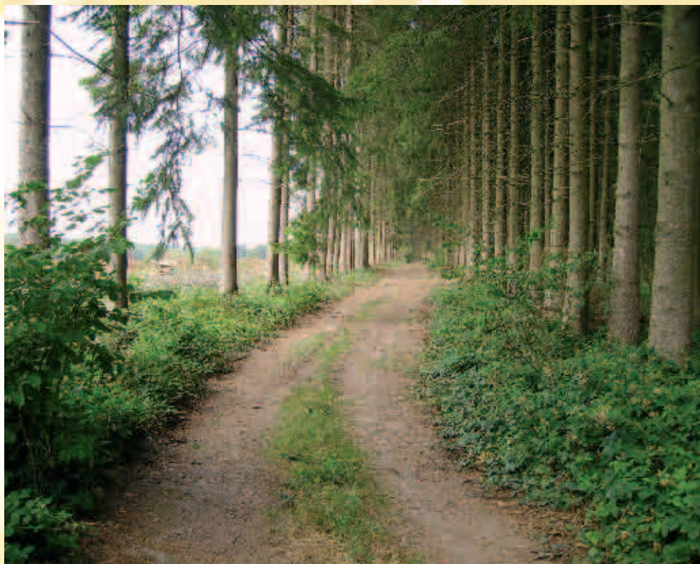
Bois de Malapaire / Bos van Malapaire

De huidige plaatsnaam Malapaire komt van de familie Malapert, die oorspronkelijk afkomstig was uit Bergen. Het waren meestersmeden uit Chimay die in de 16 e eeuw op deze plaats een ijzermeltery bezaten. Een weg die dwars door het bos Seloignes met Cendron verbond, kruiste een riviertje dat Malapert heette. Het riviertje bevoorraadde een vijver die ook al Malapert werd genoemd.