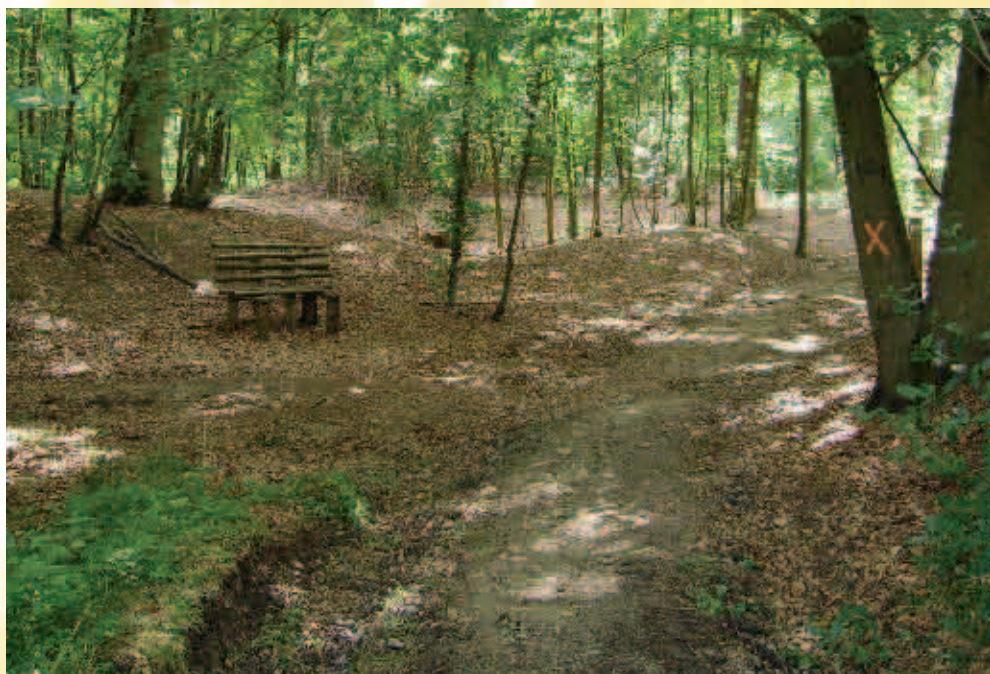
Près du lavoir de Seloignes / Dichtbij de wasbak van Seloignes

De activiteit van de klompenmakers kwam sterk in de verdrukking toen de klompenmakerij van Villers-la-Tour gemechaniseerd werd.