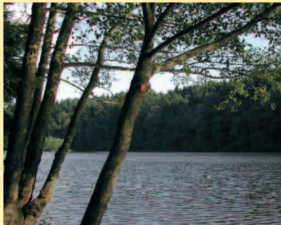
Fourneau d'Oise / Fourneau d'Oise

L'activité des sabotiers diminua fortement avec la mécanisation de la saboterie de Villers-la-Tour.