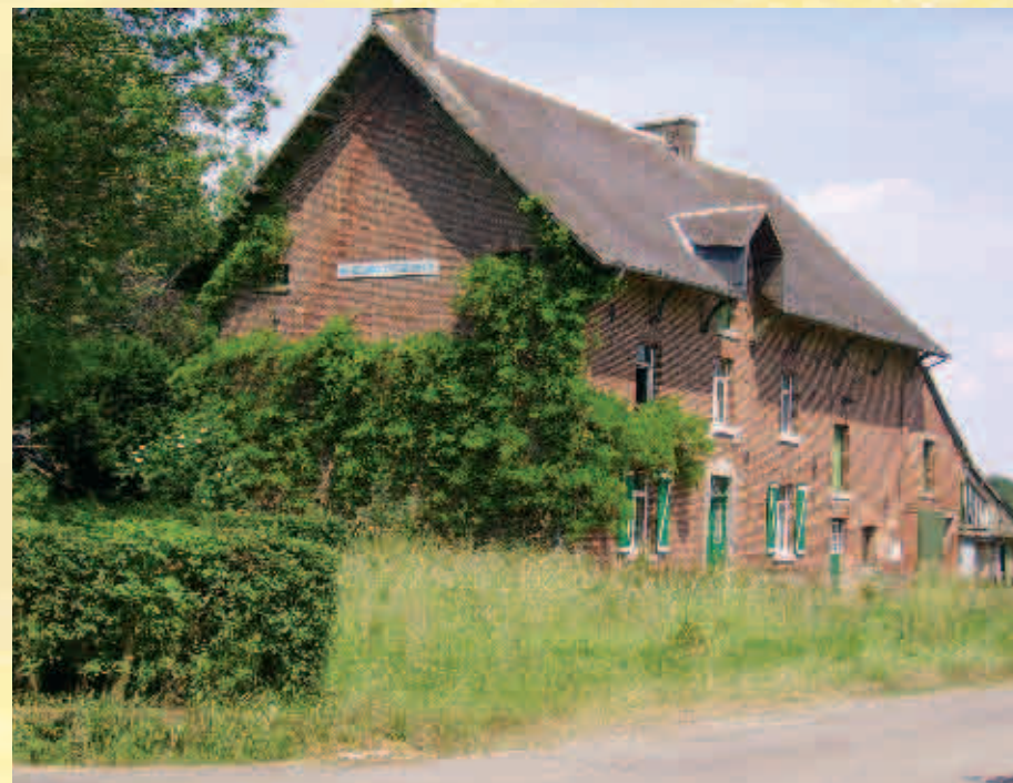
Ferme de la Distillerie / Boerderij "La Distillerie"

Cette distillerie produisait de l'alcool à consommer réalisé à partir de céréales. La porte de la cave porte encore la mention alcool. Cette distillerie semble avoir été en activité jusqu'à la fin du siècle dernier.