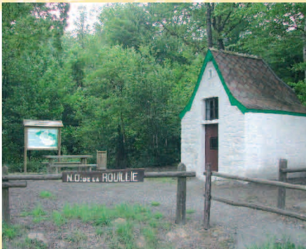
Chapelle Notre-Dame de la Rouillie / Kapel Notre-Dame de la Rouillie

De distilleerderij produceerde consumptiealcohol op basis van graangewassen. Op de kelderdeur staat nog steeds de naam 'alcool'. De onderneming was vermoedelijk actief tot het einde van de 19e eeuw.