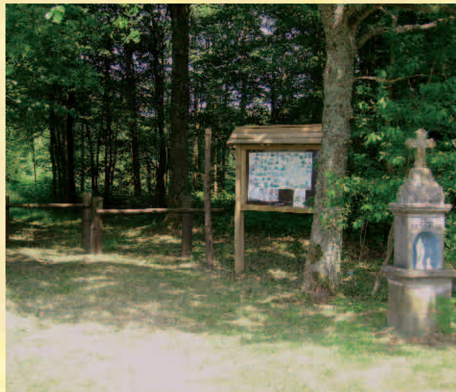
Chapelle Notre-Dame de Grâce Divine / Kapel Notre-Dame de Grâce Divine

Possibilité de prolongation vers le circuit n° 3