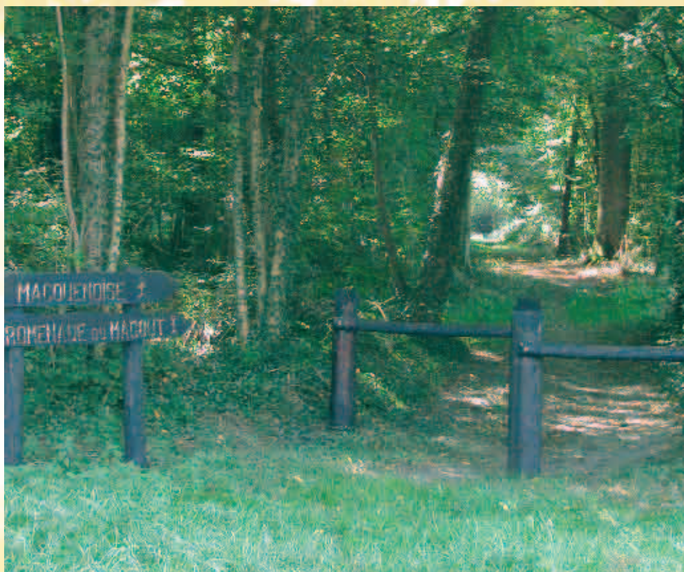
Entrée du Bois Magout / Ingang van het Bos "Magout"