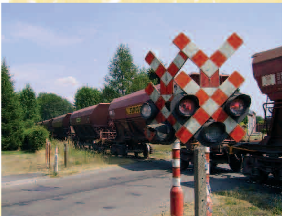
Chemin de Fer à Momignies, ligne 156 / Spoorweg van Momignies, lijn 156

De plaats die men 'Hayettes de Momignies, Haies de Macon' noemt, haalt haar naam uit de Gallische periode. In die tijd hadden de Nerviers een haag van dichte bossen aangelegd, om de opmars van de Romeinen te stuiten tijdens hun Gallische oorlog, vandaar de naam 'Franche Haie'. Wie deze wandeling volgt, kruist de spoorlijn die Chimay in de 1859 verbond met Momignies. De lijn werd in 1857 aangelegd door 'La Compagnie du Chemin de fer de Chimay' om de economische ontwikkeling te bevorderen van de streek. Het eerste traject verbond Mariembourg met Chimay. De spoorlijn werd vooral gebruikt voor het vervoer van kolen, hout en vee. Men passeert ook langs het hoogste punt van de gemeente : Martignon of Martis Ignis, het vuur van Mars, dat gewijd was de oorlogsgod Mars. Bij het verlaten van het dorp (Rue des Hayettes) ziet men de Chapelle du Saint Esprit uit de 19 e eeuw. De Rau de Courtrues is een klein riviertje waarin elk jaar vis wordt uitgezet, namelijk pootforellen en beekforellen. Op die manier wil men de forelpopulatie in de benedenloop van de rivier op peil houden. Mogelijk te verlengen met n° 2