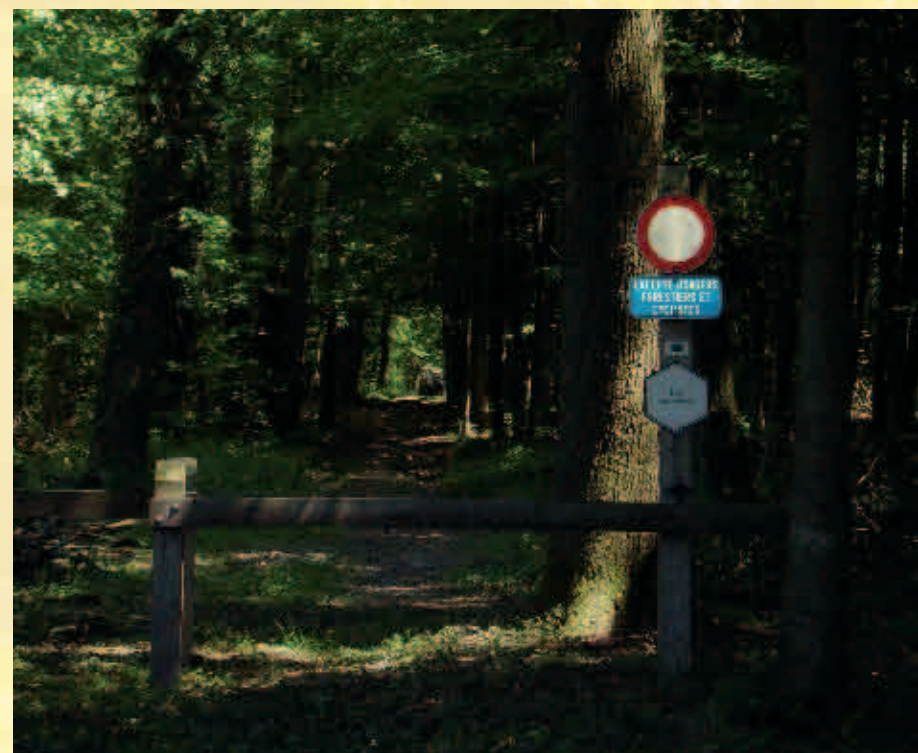
Bois des Hayettes / Bos "les Hayettes"

L'origine des lieux dits « Hayettes de Momignies, Haies de Macon » remonte à l'époque gauloise : à cette époque, les Nerviens avaient construit une haie épaisse de forêts, très serrée, pour enrayer l'avancée des Romains lors de la conquête de la Gaule d'où le nom de « Franche Haie ». En empruntant cette randonnée, on franchit le chemin de fer qui reliait en 1859, Chimay à Momignies. Cette ligne fut créée en 1857 par « La Compagnie du Chemin de fer de Chimay » afin de favoriser le développement économique de la région et le premier tronçon reliait Mariembourg à Chimay. Cette ligne était utilisée pour le transport du charbon, du bois et du bétail principalement. Aujourd'hui, cette ligne n'est plus utilisée que pour les transports de pierres provenant de la carrière de Wallers en France. A la sortie du village, (Rue des Hayettes), on peut observer la Chapelle du Saint Esprit datée du 19 e s. Le Rau de Courtrues, est un petit ruisseau dans lequel chaque année, un rempoissonnement en alvins et en truites fario est effectué en vue de maintenir une population en truites sauvages dans la partie basse de la rivière. Possibilité de prolongation vers le circuit n° 2