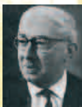
Arthur Masson (1896-1970)

Op 2 km van de Abdij van Scourmont ligt het dorp Rièzes. Daar werd in 1896 Arthur Masson geboren, één van de grootste Waalse schrijvers. Hij liet een dertigtal boeken na, waaronder de beroemde serie rond het personage Toine Culot (Toine Culot, obèse ardennais; Toine maieur de Trignolles; Toine dans la tourmente...). Hij verliet Rièzes op zevenjarige leeftijd, maar kwam terug naar Chimay voor zijn middelbare studies. Kort voor zijn militaire dienst gaf hij les aan het Koninklijk Atheneum. In Treignes is een spektakelparcours aan hem gewijd (richting Couvin-Nismes).