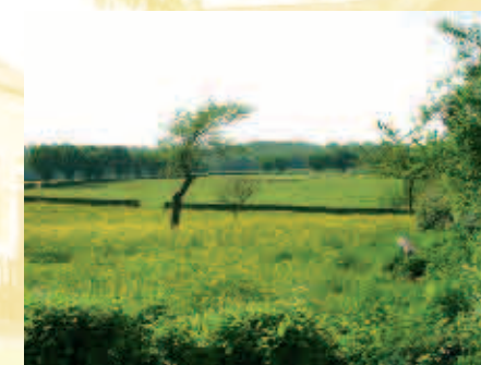
Paysage de Thiérache - Landschap van Thiérache

C'est au village de Rièzes, à 2 km de l'Abbaye de Scourmont, qu'est né Arthur Masson (1896). Il restera un des plus grands écrivains wallons, auteur d'une trentaine de livres, dont la célèbre série consacrée au personnage de Toine Culot (Toine Culot, obèse ardennais; Toine maieur de Trignolles; Toine dans la tourmente...). Il quittera Rièzes à l'âge de 7 ans avant de revenir à Chimay pour faire ses humanités, et peu avant son service militaire, pour enseigner à l'Athénée Royal. Un parcours-spectacle lui est consacré à Treignes (direction Couvin-Nismes).