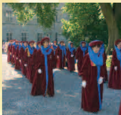
Jurade Princièrre de Chimay