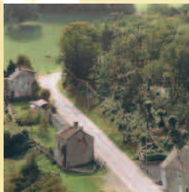
Le village de Lompret - Het dorp Lompret