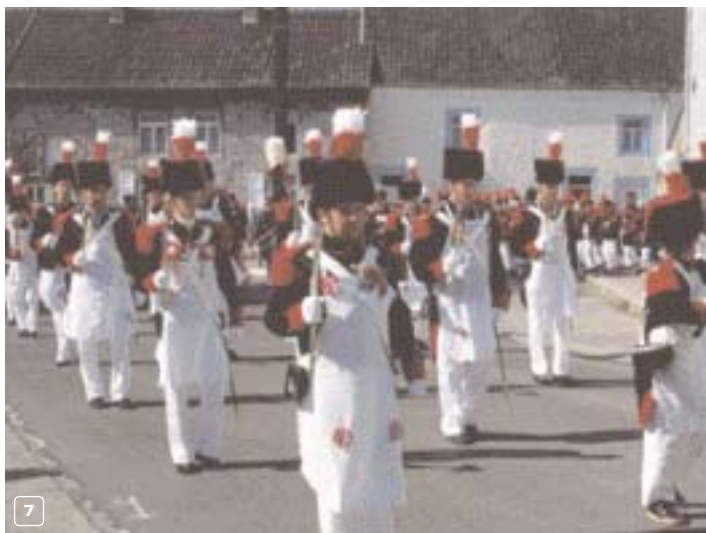
Une des marches folkloriques et militaires de l'Entre-Sambre-et-Meuse

village intéressant de Senzeille, qui possède entre autres un château du XVII e siècle, avec trois tours d'angle, et une place arborée près de l'église néogothique Saint-Martin.