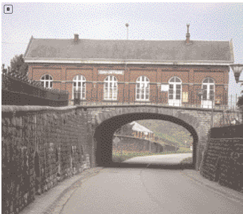
Le musée régional de Cerfontaine a trouvé un toit dans l'ancienne gare

Le Relais du Surmoy, rue de Bironfosse 38, 5630 Soumoy-Cerfontaine, ☎ +32 (0)71 64 32 13, 📞 +32 (0)71 64 47 09, ✉ relais.surmoy@belgacom.net